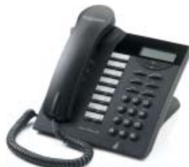
Forum™ Phone 320