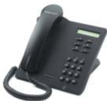
Forum™ Phone 310

Die digitalen Telefone der Reihe Forum™ Phones verbinden Komfort und Funktionalität mit Bedienungsfreundlichkeit. Über die Tastatur Ihres Telefons verwalten Sie perfekt Ihre Kommunikationen und vermitteln damit Ihren Gesprächspartnern einen Eindruck von Effizienz und Professionalität.